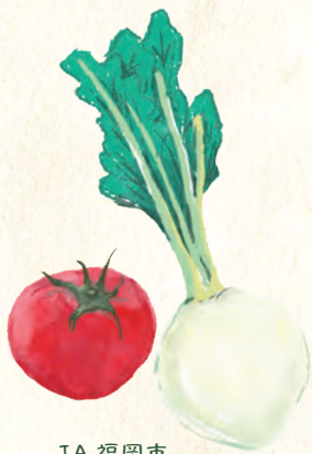
JA 福岡市 博多じょうもんさん入部市場