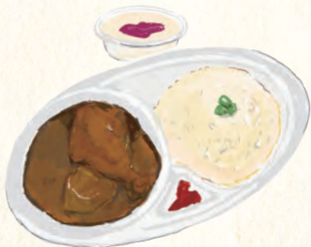
中村学園大学 薬膳・食育ボランティア部