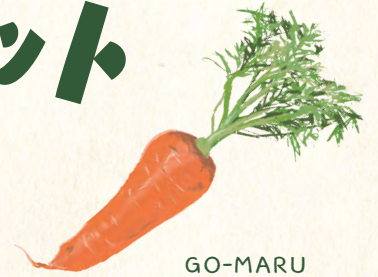
GO-MARU WITH SANDWICH