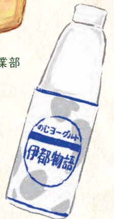
糸島みるくぶらんと 伊都物語