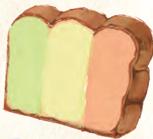
中村学園事業部 カフェ&ベーカリー アステックス