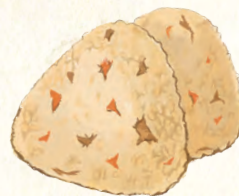
中村学園大学・短期大学部合同 食物研究部